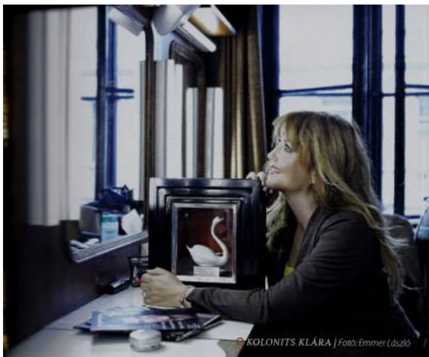
© KOLONITS KLÁRA | Fotó: Emmer László