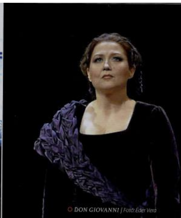
© DON GIOVANNI | Fotó: Eder Vera

„Jövőre huszonhét előadásom van itthon, és ez a nők között extrém soknak számít” – mondja, és hozzátéveszi, húsz-harminc évvel ezelőtt sokkal több lehetőség volt a szerepkörében, szélesebb volt a repertoár, egy-egy énekesre ötven körüli előadás jutott a főszerepekből. De ezt csupán tényként említi, egyáltalán nem panaszkodik, és nem érzi, hogy a műfajt tetetni kellene. „Az elmúlt időszak tapasztalatainak köszönhetően egyre inkább az a meggyőződéseim, hogy az érdeklődés nem csökken, inkább úgy fogalmaznék, a hozzáférés lehetőségei szűkültek. Ez egy nagyon drága műfaj, ami a jegyárban is megmutatkozik, de azzal, hogy az Erkel Színház visszakerül a palettára, már most érezhető a növekedés. Nem hiszek abban, hogy az opera kevesebb embert érdekel, mert mindig felnő egy korosztály, akiknek ez a műfaj fontos lesz.”